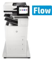
HP LaserJet Enterprise MFP M631/M632 -sarja