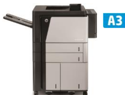
HP LaserJet Enterprise M806 -tulostinsarja