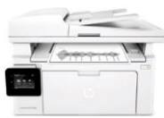
HP LaserJet Pro M130 -sarja