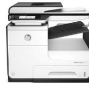
HP PageWide 377dw / Pro 477dw - monitoimitulostin