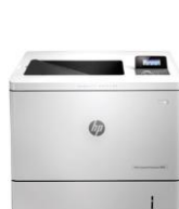
HP Color LaserJet Enterprise M552dn -tulostin