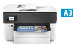
HP OfficeJet Pro 7720/7730 Wide Format All-in-One