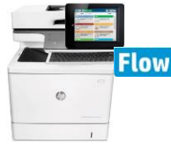
HP Color LaserJet Enterprise MFP M577 -sarja