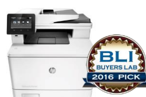
HP Color LaserJet Pro MFP M477 -sarja 29