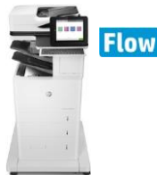
HP LaserJet Enterprise MFP M632 -sarja