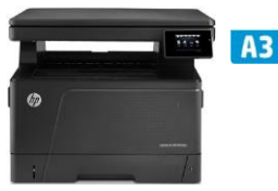
HP LaserJet Pro MFP M435nw 21