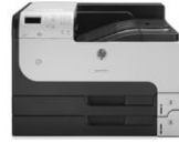
HP LaserJet Enterprise 700 Printer M712 -tulostinsarja