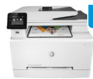
HP Color LaserJet Pro MFP M280/M281 -sarja