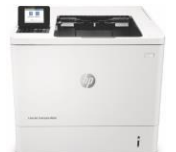
HP LaserJet Enterprise M608 -tulostinsarja