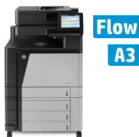
HP Color LaserJet Enterprise flow MFP M880z -sarja