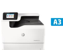
HP PageWide Pro 750dw -tulostin