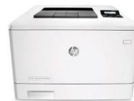
HP Color LaserJet Pro M452 -sarja