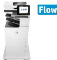
HP Color LaserJet Enterprise Flow MFP M682z