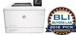
HP LaserJet Pro M452 -sarja 29