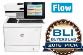
HP Color LaserJet Enterprise MFP M577 -sarja 29