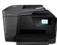
HP OfficeJet Pro 8710 All-in-One