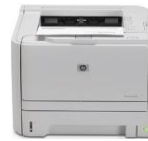
HP LaserJet P2035 -tulostin