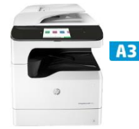
HP PageWide Pro 772dn, 777z MFP