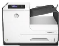
HP PageWide 352dw/Pro 452dw -tulostin