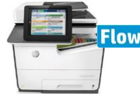
HP PageWide Enterprise Color MFP 586 -sarja