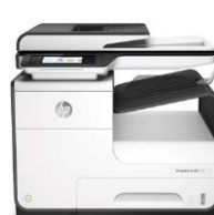
HP PageWide Pro 477dw MFP