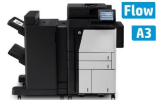
HP LaserJet Enterprise flow MFP M830z