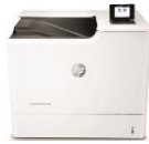
HP Color LaserJet Enterprise M652/M653 -tulostinsarja