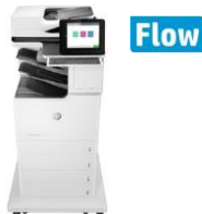
HP Color LaserJet Enterprise MFP M681 -sarja