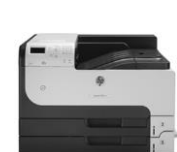
HP LaserJet Enterprise 700 M712 -tulostinsarja