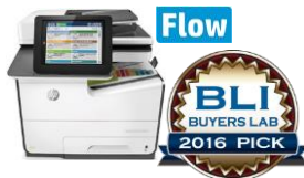
HP PageWide Enterprise Color MFP 586 -sarja 29