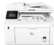
HP LaserJet Pro MFP M227 -sarja