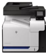
HP LaserJet Pro 500 color MFP M570 -sarja