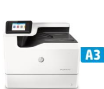
HP PageWide Pro 750dw -tulostin