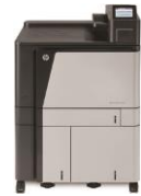
HP Color LaserJet Enterprise M855 -tulostinsarja