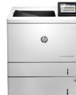
HP Color LaserJet Enterprise M553 -tulostinsarja