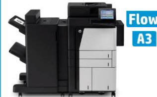
HP LaserJet Enterprise flow MFP M830z