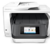
HP OfficeJet Pro 8710/8720/8730/8740 -All-in-One -sarja