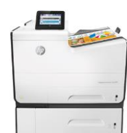
HP PageWide Enterprise Color 556 -tulostinsarja