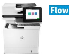
HP LaserJet Enterprise MFP M631 -sarja