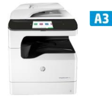
HP PageWide Pro 777z MFP