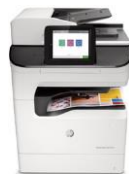
HP PageWide Enterprise Color MFP 780 -sarja