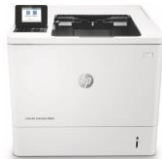
HP LaserJet Enterprise M607, M608, M609 -tulostinsarja