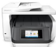
HP OfficeJet Pro 8720/8730/8740 All-in-One