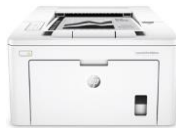
HP LaserJet Pro M203 -tulostinsarja