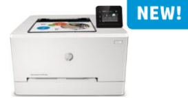
HP Color LaserJet Pro M254 -tulostinsarja