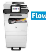
HP PageWide Enterprise Color MFP 785 -sarja