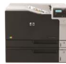
HP Color LaserJet Enterprise M750 -tulostinsarja