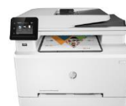
HP Color LaserJet Pro MFP M280/M281 -sarja

7720: Jopa 250 arkkia 7730: Jopa 500 arkkia