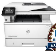
HP LaserJet Pro MFP M426 -sarja 29