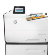
HP PageWide Enterprise Color 556 -tulostinsarja