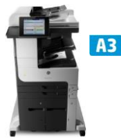
HP LaserJet Enterprise MFP M725 -sarja