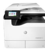
HP PageWide Pro 772dn MFP