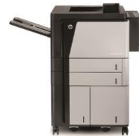
HP LaserJet Enterprise M806 -tulostinsarja