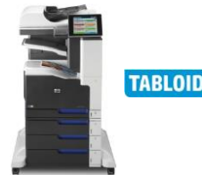
HP LaserJet Enterprise 700 color MFP M775 -sarja