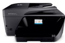
HP OfficeJet Pro 6960/6970 All-in-One