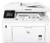
HP LaserJet Pro MFP M227 -sarja