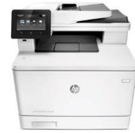
HP Color LaserJet Pro MFP M477 -sarja