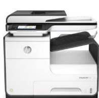
HP PageWide 377dw MFP