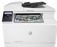
HP Color LaserJet Pro MFP M180n/M181fw