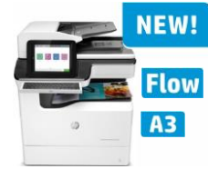
HP PageWide Enterprise Color MFP 780- ja 785-sarja