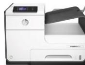
HP PageWide Pro 452dw -tulostin