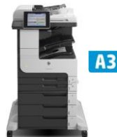
HP LaserJet Enterprise MFP M725 -sarja