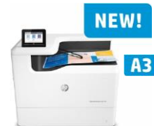
HP PageWide Enterprise Color 765dn -tulostin