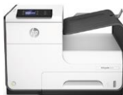
HP PageWide 352dw -tulostin