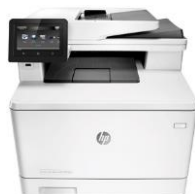
HP Color LaserJet Pro MFP M377dw