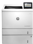
HP Color LaserJet Enterprise M552/M553 -tulostinsarja