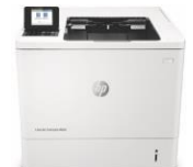
HP LaserJet Enterprise M609 -tulostinsarja