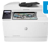
HP Color LaserJet Pro MFP M180n/M181fw