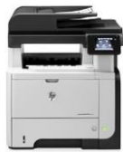
HP LaserJet Pro MFP M521 -sarja