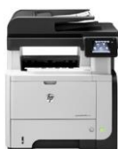
HP LaserJet Pro MFP M521 -sarja