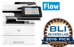
HP LaserJet Enterprise MFP M527 -sarja 29