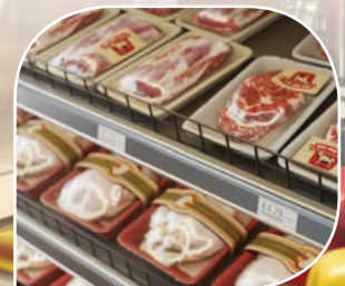
Hintamerkinnot myymälöiden hyllyihin