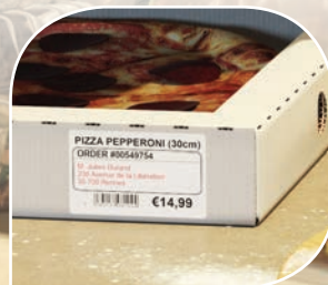
Take away -tilaukset

Tarkka sisältömerkintä, kuten allergeenit, parasta ennen päiväykset ja viimeinen käyttöpäivä -tarrat ovat kaikki elintarviketeollisuuden ostajille välittämää tärkeää tietoa ja tiedon tulostamisen tulee tarvittaessa onnistua nopeasti. Samoin hintalappuihin tulisi voida tulostaa hinnan lisäksi EAN-8 tai EAN-13 -viivakoodi. QL820NWB toimii itsenäisenä tulostimena ja on siksi ideaali käytettäväksi kahviloissa ja ravintoloissa. Take away -annoksia myyvien ravintoloiden on helppo tulostaa tilauksen tiedot sekä asiakkaan toimitusosoite