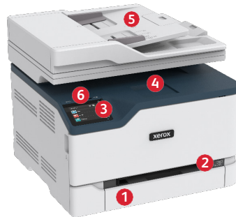
Xerox® C235 -värimonitoimitulostin