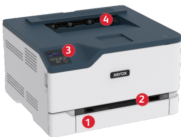
Xerox® C230 -väritulostin